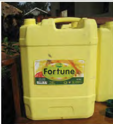
Figure 7: Recycled 10-L edible oil container, Kamuli, Uganda Şekil 7: Geri dönüşümlü 10-L Yemeklik yağ konteynir, Kamuli, Uganda

Recycled plastic containers: Used containers are readily available at low prices in markets in sub-Saharan Africa. One common type of plastic container originally contains edible oil (Figure 7). Used 10-L plastic oil containers like the one in Figure 7 are available in Kamuli, Uganda for US$1 each. They will hold approximately 7-8 kg of maize. In order to test the concept of using recycled edible oil containers for hermetic maize storage; an experiment was conducted to compare 10-L hermetically-sealed containers and identical containers with screen caps. Weevil-infested maize was purchased in the local