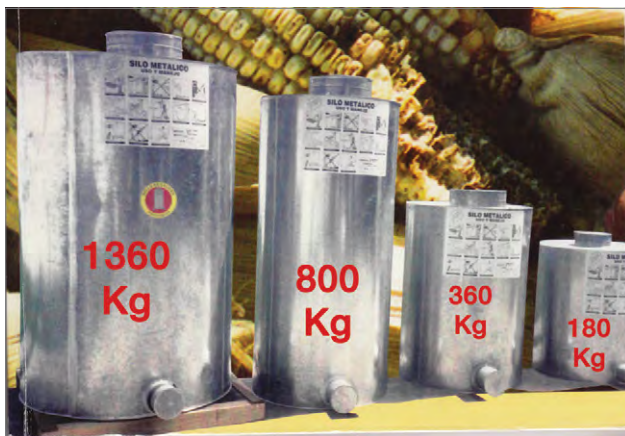
Figure 2: Postcosecha steel silos (Bravo-Martinez 2009)

Postcosecha silolar, 26 ayar (gauge) (0.7 mm) galvanize çelik levhalar ve kurşun esaslı lehimlerle basit araçlar