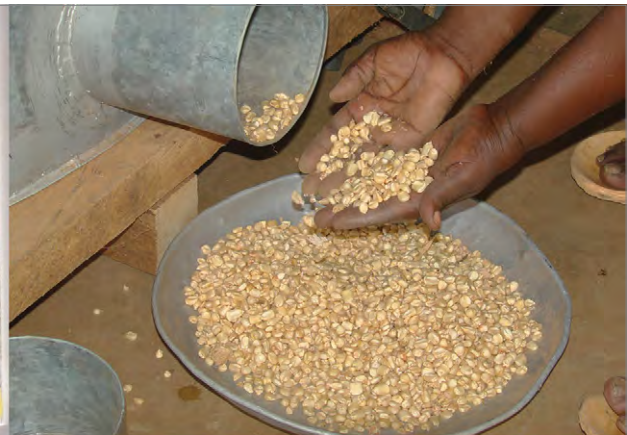
Figure 3: Removing maize from silo (SDC 2013) Şekil 3: Mısır silodan çıkarılırken