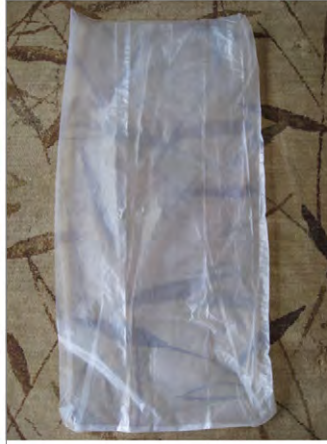
Figure 4: PICS 80- \mu m polyethylene inner bag Őekil 4: PICS 80 mikron polietilen i uval

SuperGrainbag IIITM ise kk lekli iftliklerde mısırdopolamak iin kullanmaya uygun bir tiptir. 30-100 kg'lık mısırdopolama kapasitesi vardır. Mısırdopolama yanı sıra, aynı zamanda kahve, eltik, piri, sorgum, darı, soya fasulyesi, buđ-