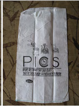
Figure 5: PICS woven outer bag řekil 5: PICS dıř dokuma uval