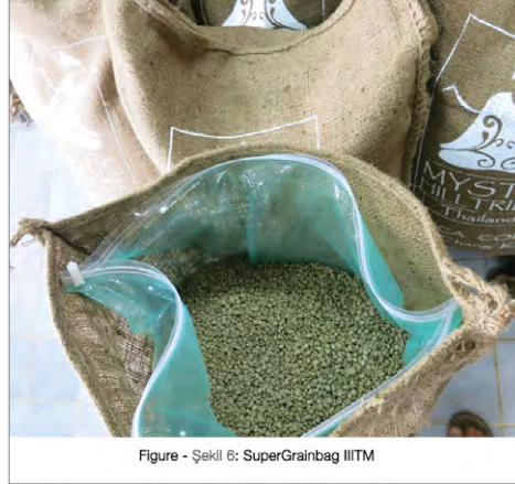
Figure - Şekil 6: SuperGrainbag IIITM

ghum, millet, soybeans, wheat, cocoa, beans, peas, lentils, and all types of seeds. Product is placed in the 78- \mu m multilayer polyethylene bag (which has a proprietary barrier layer that makes its permeability to oxygen far lower than polyethylene alone). It uses a two-track zipper and is sealed using a zipper slider. The sealed bag is then placed in a protective woven outer bag (Figure 6). The SGB IIITM membrane has an oxygen transmission rate of 4.28 cm 3 m -2 day -1 and a water vapor permeability of 2.14 g cm -2 day -1 . The 70-kg bag costs $2.50 + shipping in 200-bag lots (GrainPro 2013). Outer protective bags cost about $1US. Maize can be stored for up to two years in a storage cycle. With careful use, the bag will last for about five cycles. Punctures can be repaired with tape.