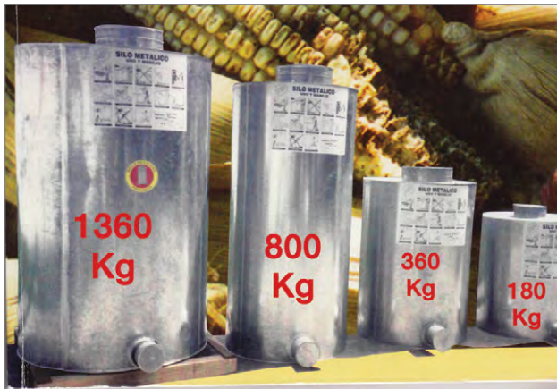
Figure 2: Postcosecha steel silos (Bravo-Martinez 2009) Şekil 2: Postcosecha çelik silolar

Postcosecha silolar, 26 ayar (gauge) (0.7 mm) galvanize çelik levhalar ve kurşun esaslı lehimlerle basit araçlar