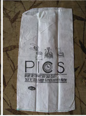
Figure 5: PICS woven outer bag Őekil 5: PICS dıř dokuma uval