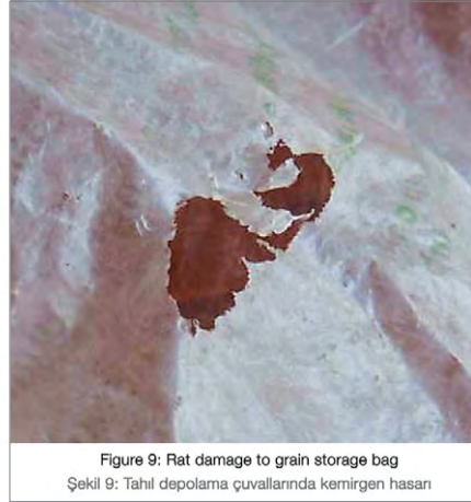
Figure 9: Rat damage to grain storage bag Şekil 9: Tahıl depolama çuvalarında kemirgen hasarı

Table 1 summarizes capacities, costs, and life estimates for the four storage systems discussed. The last column shows storage cost in dollars per metric ton per year, based only on original container cost. By this measure,